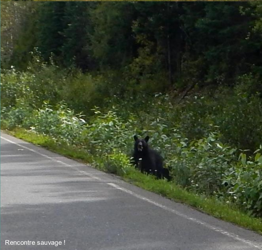
Rencontre sauvage !