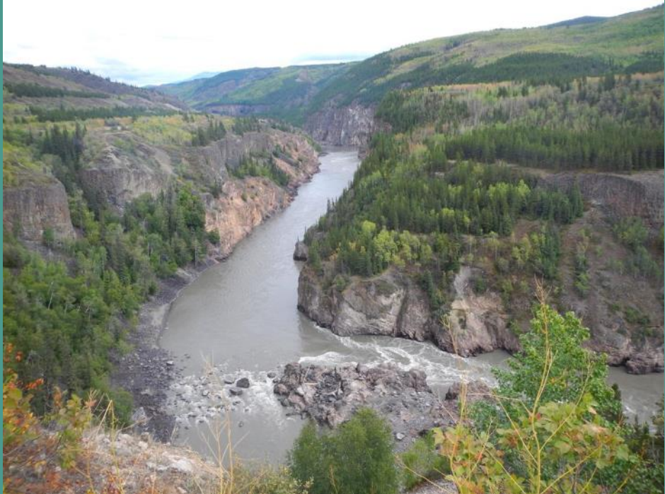
Visite au petit matin !