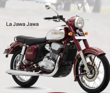
La Jawa Jawa

Après avoir présenté en 2018 une 350cc Jawa utilisant la chinoise Shine-ray XY 400, qui sert de base à la Mash Five Hundred, recyclant l'indestructible moteur de la Honda XR 400, sans suite, Mahindra, le propriétaire indien de la marque tchèque, la refait venir sur la scène. Deux motos, Jawa Jawa et Jawa Forty Two, mono 4 temps injection de 293cc, double arbre, refroidissement liquide, 4 soupapes développant 27cv reprennent les codes esthétiques historiques. Disque de 280mm à l'avant, fourche télescopique et bi amortisseurs arrière, le poids à vide s'affiche à 170kg. Ces machines seront disponibles sur le marché local, au-dessus de 2000€, prix légèrement supérieur au 350 Bullet, en 2019. Pas d'importateur donc pas d'importation prévu en France.