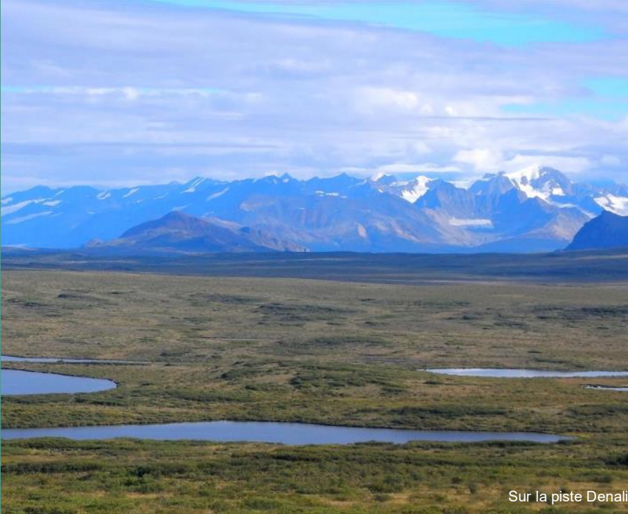
Sur la piste Denali

Le lendemain nous reprenons notre route vers le nord jusqu'à Toc avant de pouvoir enfin redescendre plein sud à travers de superbes paysages de montagnes dominées par des sommets enneigés, de lacs et de forêts d'épinettes, du pur bonheur ! Nous repassons au Yukon Canada. En Amérique du nord on trouve facilement dans des paysages superbes des campgrounds, camping minimaliste offrant des emplacements bien délimités avec une belle table, des wc rudimentaires et parfois un point d'eau. En fait, ils sont prévus pour les américains et leurs immenses caravanes (jusqu'à 30 m 2 une fois déployées !). Pas