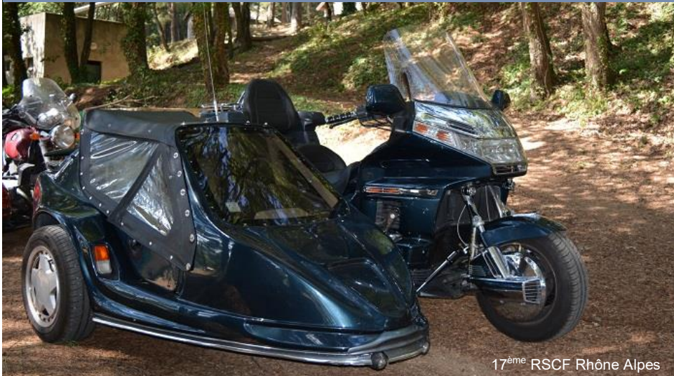
17 ème RSCF Rhône Alpes