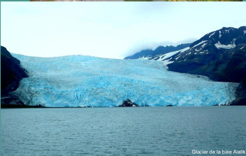
Glacier de la baie Aialik