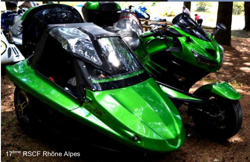
17 ème RSCF Rhône Alpes

Sidkar Attitude, c'est votre rubrique alors envoyez vos photos à asfra@sfr.fr