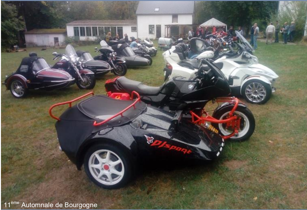
11 ème Automnale de Bourgogne

c'est votre rubrique alors envoyez vos photos à asfra@sfr.fr