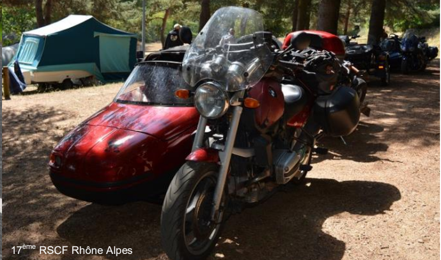
17 ème RSCF Rhône Alpes