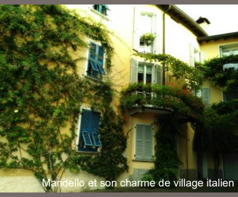
Mandello et son charme de village italien