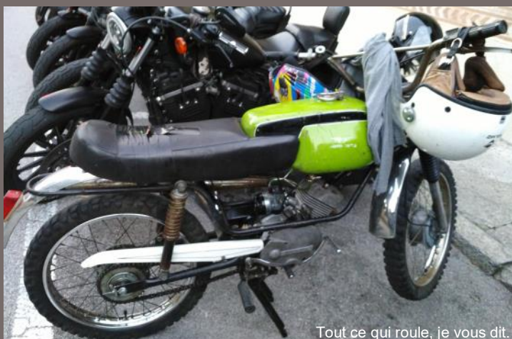
Tout ce qui roule, je vous dit.