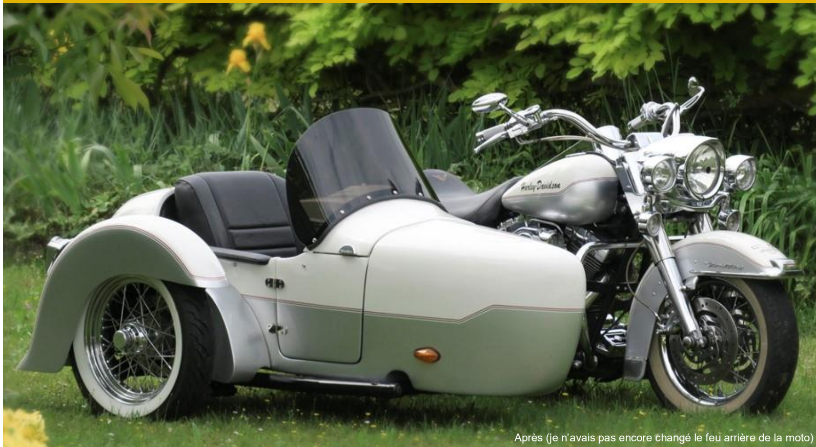
Après (je n'avais pas encore changé le feu arrière de la moto)