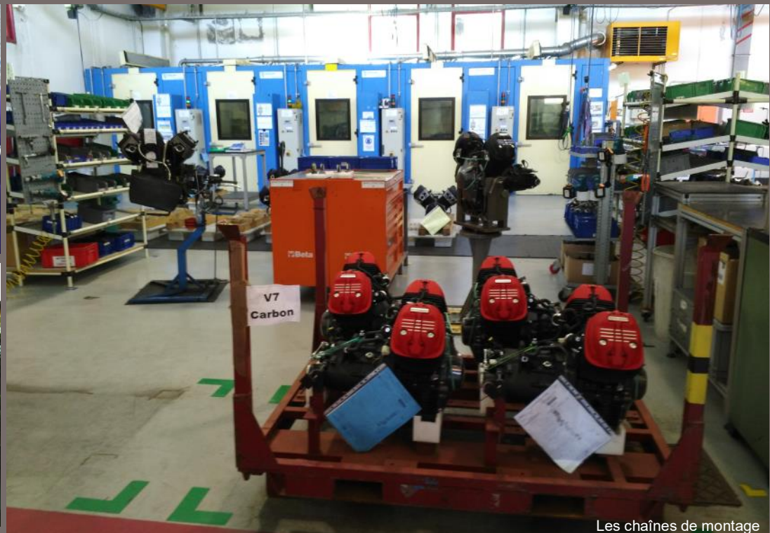
Les chaînes de montage