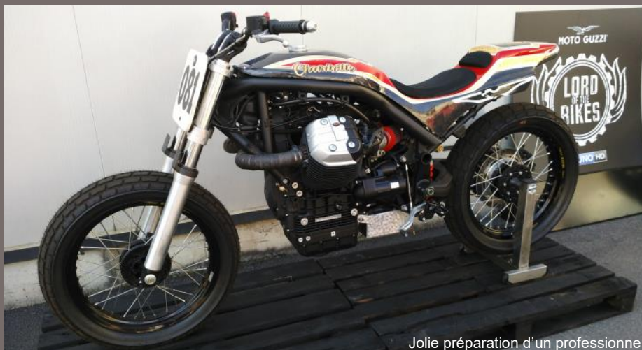
Jolie préparation d'un professionnel