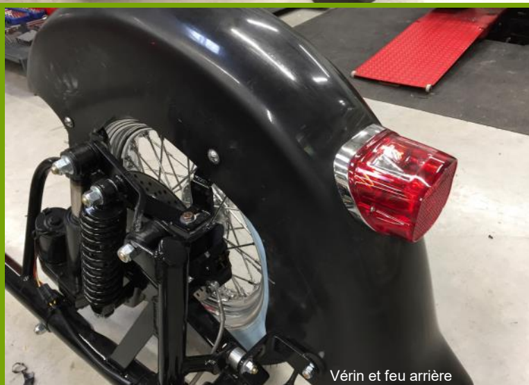
Vérin et feu arrière

Le feu arrière était celui d'origine Harley, pas vraiment beau (à mon goût) celui de ma moto était différent je l'avais changé. Je leur ai envoyé un feu Tomstone pour qu'ils me le remplacent et j'ai monté le même sur la moto.