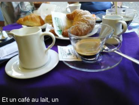
Et un café au lait, un