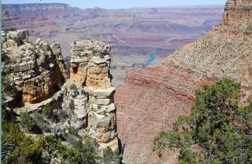
Le Grand Canyon du Colorado

Pour la petite histoire, Death Valley a été prospectée pour le bore. Puis lorsque la mine n'a plus été rentable, la société qui l'exploitait a décidé de transformer ses bâtiments en centre de loisirs : ce fut le début du tourisme dans cette région désertique.