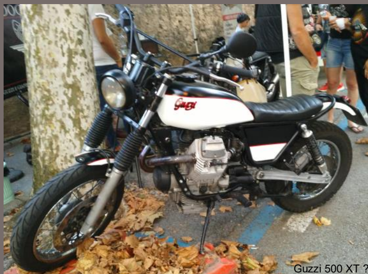
Guzzi 500 XT ?