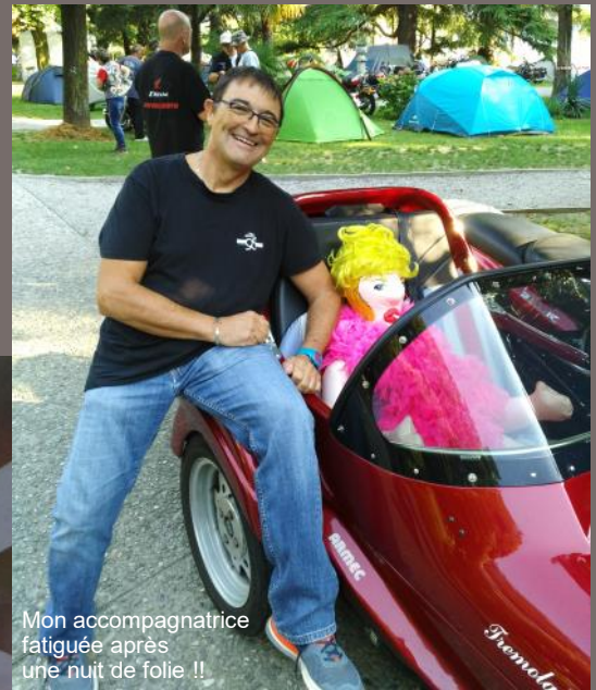
Mon accompagnatrice fatiguée après une nuit de folie !!

Le lac de Côme ou lago di Como (parfois appelé Lario, par référence au Larius lacus des Romains) est un lac des Alpes italiennes, situé dans le nord de l'Italie, en Lombardie, à environ 45 km au nord de Milan. Profond de 410 m, situé à 201 m d'altitude, le lac de Côme est l'un des plus importants lacs italiens, avec 140 km de pourtour et 146 km 2 de superficie.