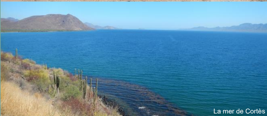
La mer de Cortès