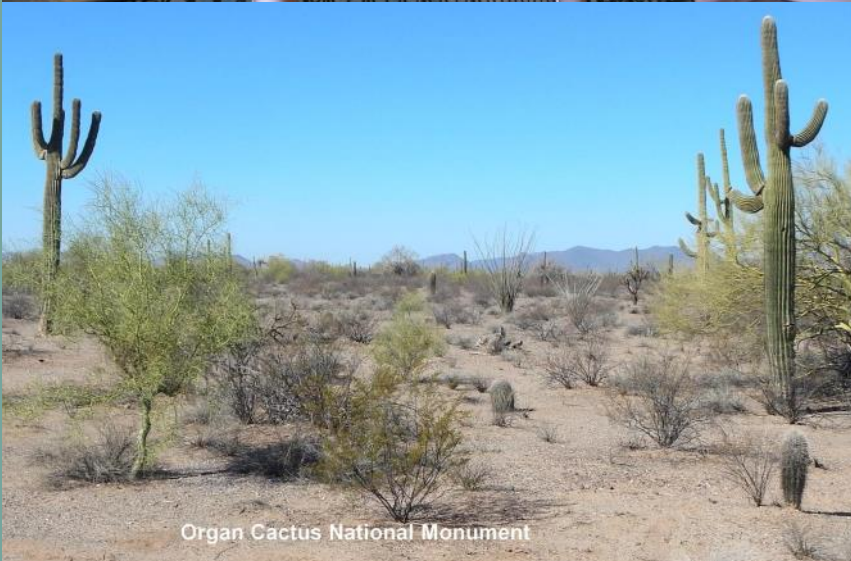
Organ Cactus National Monument