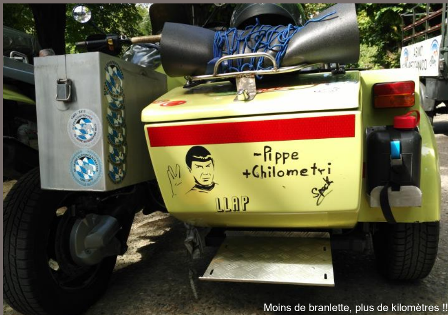
Moins de branlette, plus de kilomètres !!

On vient pour participer à la grande messe, croiser des potes qu'on n'a plus vu depuis des