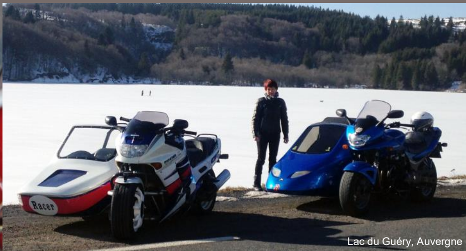
Lac du Guéry, Auvergne

Sidkar Attitude, c'est votre rubrique alors envoyez vos photos à asfra@sfr.fr