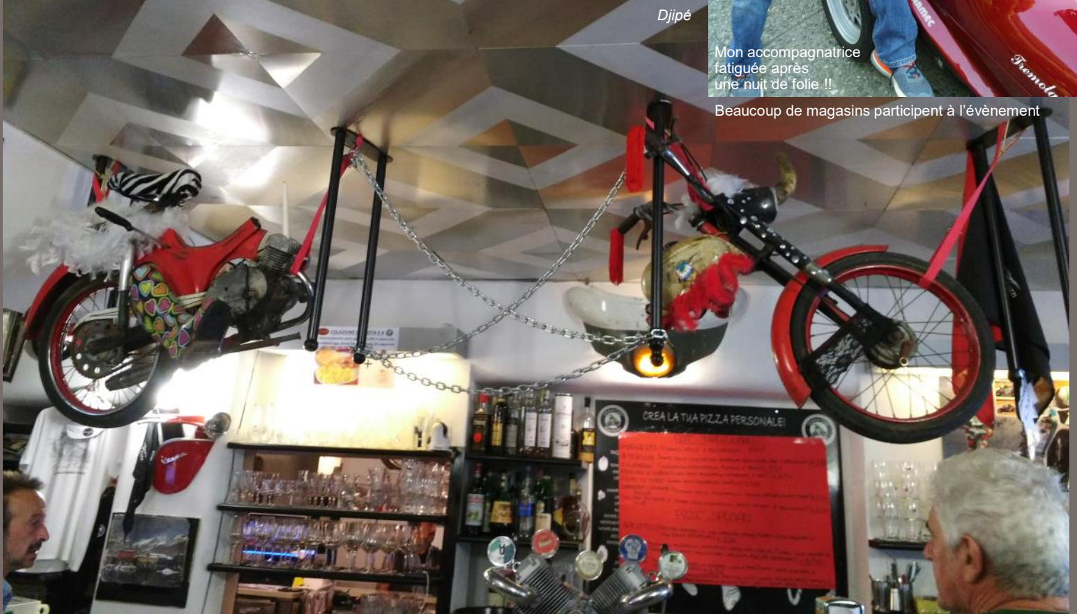
Beaucoup de magasins participent à l'évènement