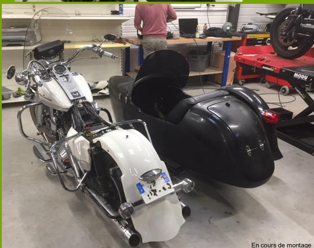
En cours de montage

Le feu arrière était celui d'origine Harley, pas vraiment beau (à mon goût) celui de ma moto était différent je l'avais changé. Je leur ai envoyé un feu Tomstone pour qu'ils me le remplacent et j'ai monté le même sur la moto.