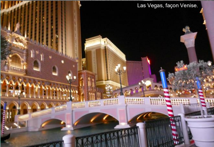
Las Vegas, façon Venise.

Nous reprenons la route qui traverse un paysage quelconque sous une température de 40°C et nous amène jusqu'au Mexique où nous pénétrons sans