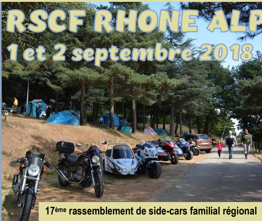
17 ème rassemblement de side-cars familial régional