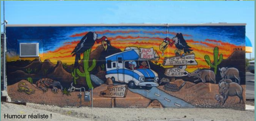
Humour réaliste !