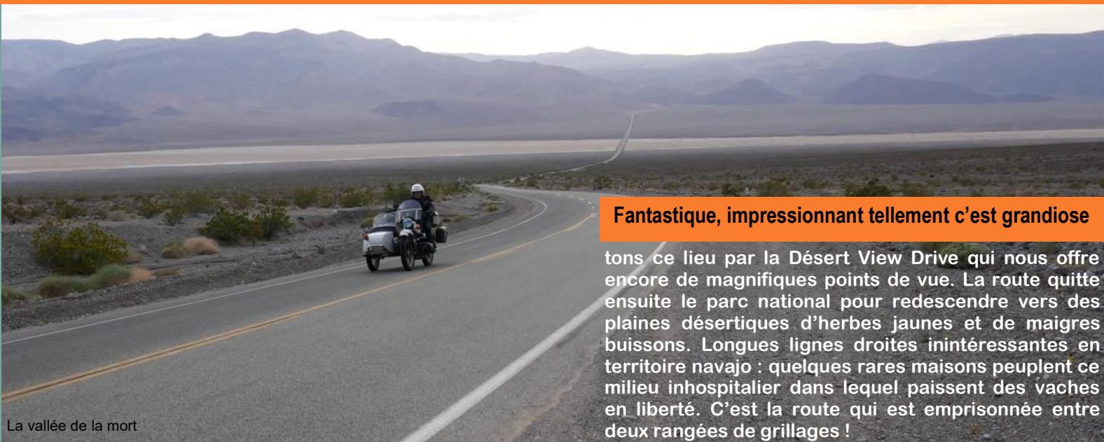
La vallée de la mort