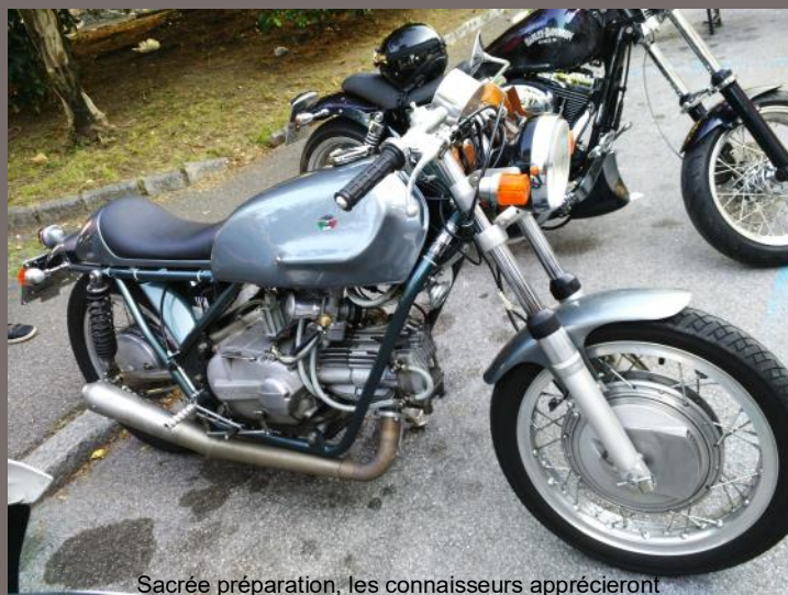
Sacrée préparation, les connaisseurs apprécieront

Et voilà arrivé le dimanche où il faut plier les tentes, et hop ! un petit bain, un dernier café qui réveille grave, puis reprendre la route pour retourner dans notre train-train quotidien. Les premières dizaines de kilomètres en quittant MANDELLO, on a croisé des centaines de motards et d'automobilistes qui montaient profiter du spectacle du village envahi de bécanes.