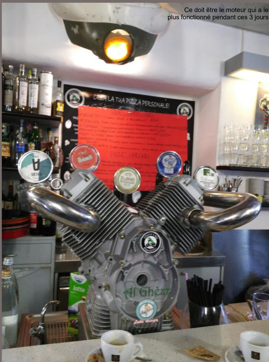
Ce doit être le moteur qui a le plus fonctionné pendant ces 3 jours

Partis du Var et des Alpes Maritimes, en side, Guzze, Harley, jap, nous voilà en route dès 8H00 du mat le vendredi pour rejoindre Mandello situé à 450 bornes de Nice, dont une majorité à faire par l'autoroute pour ne pas arriver trop tard (on part à 8H00 du mat et on arrive à... 16H00 et sans panne. Alors imaginez en cas de panne à quelle heure on serait arrivé !).