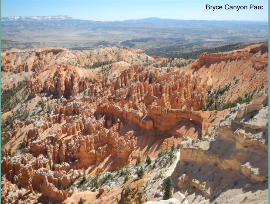
Bryce Canyon Parc