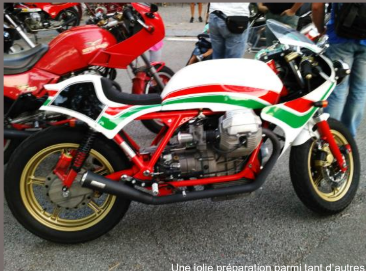
Une jolie préparation parmi tant d'autres