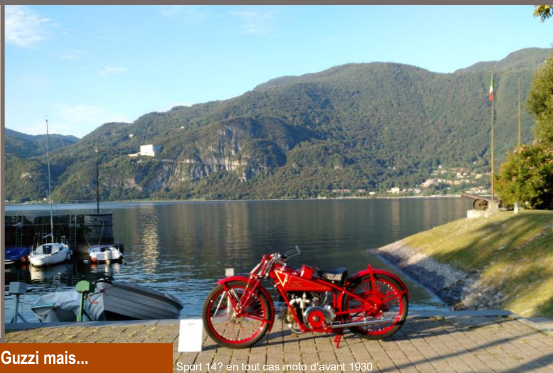
Sport 14? en tout cas moto d'avant 1930