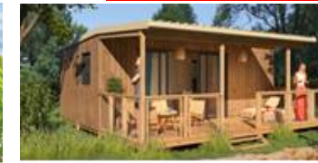
Bungalows 4 pers