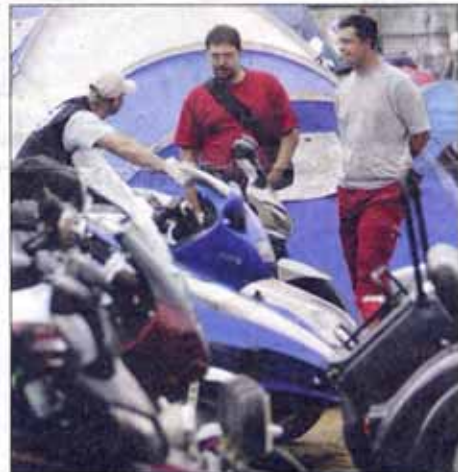
Le rassemblement se termine mercredi / Photo Maxime Jégit

> Aujourd'hui : baptêmes de side-cars de 10 à 12 heures ; lundi, réunion d'information side-car de 16 à 18 heures. Animations et jeux pour enfants toute la journée. A Montrottier jusqu'à mercredi. Rens. 04 74 70 90 64.