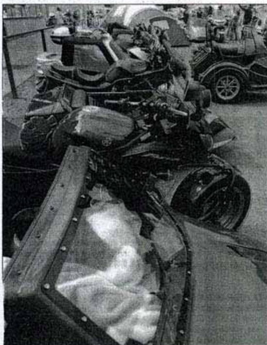
Rassemblement de side-cars / Maxime Jogat