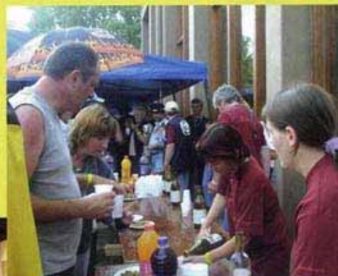
[Ci-contre] Moment de convivialité en soirée