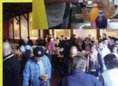
[Ci-dessus] Le p'tit-déj'