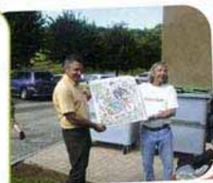
Le doyen de la manifestation